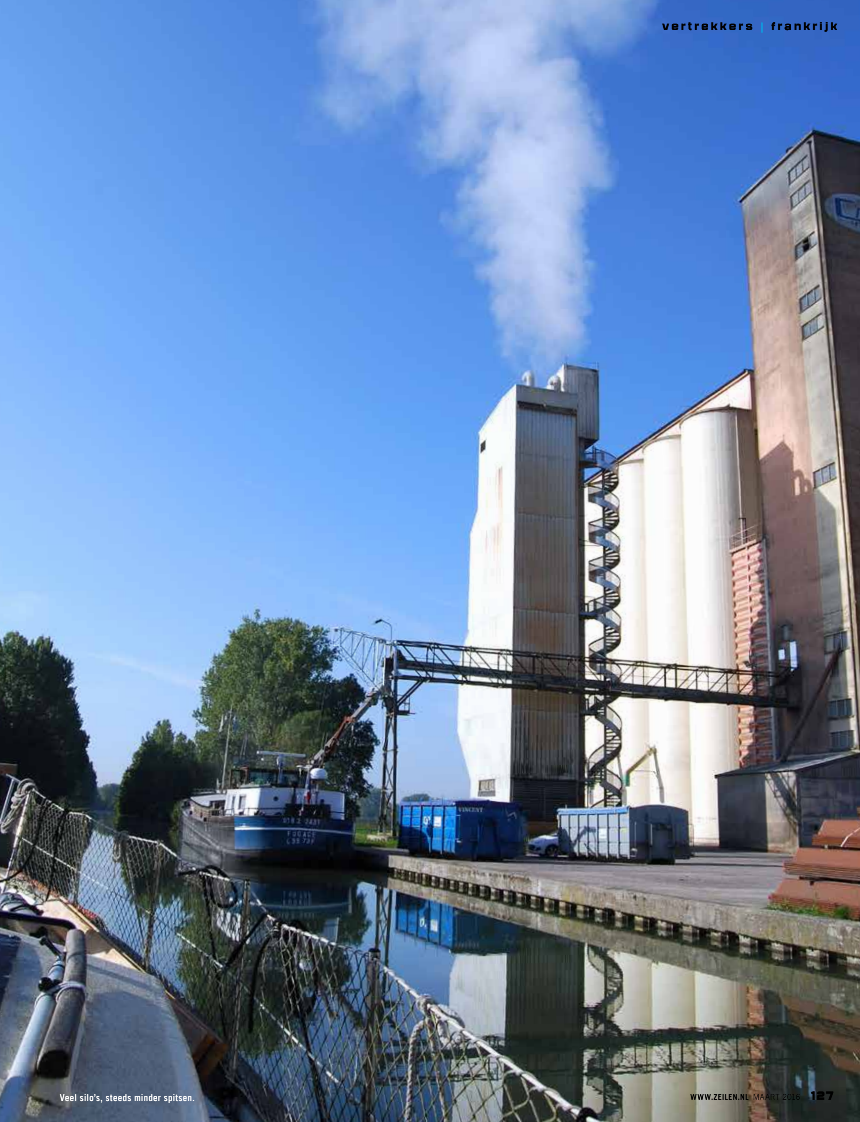
Veel silo's, steeds minder spitsen.