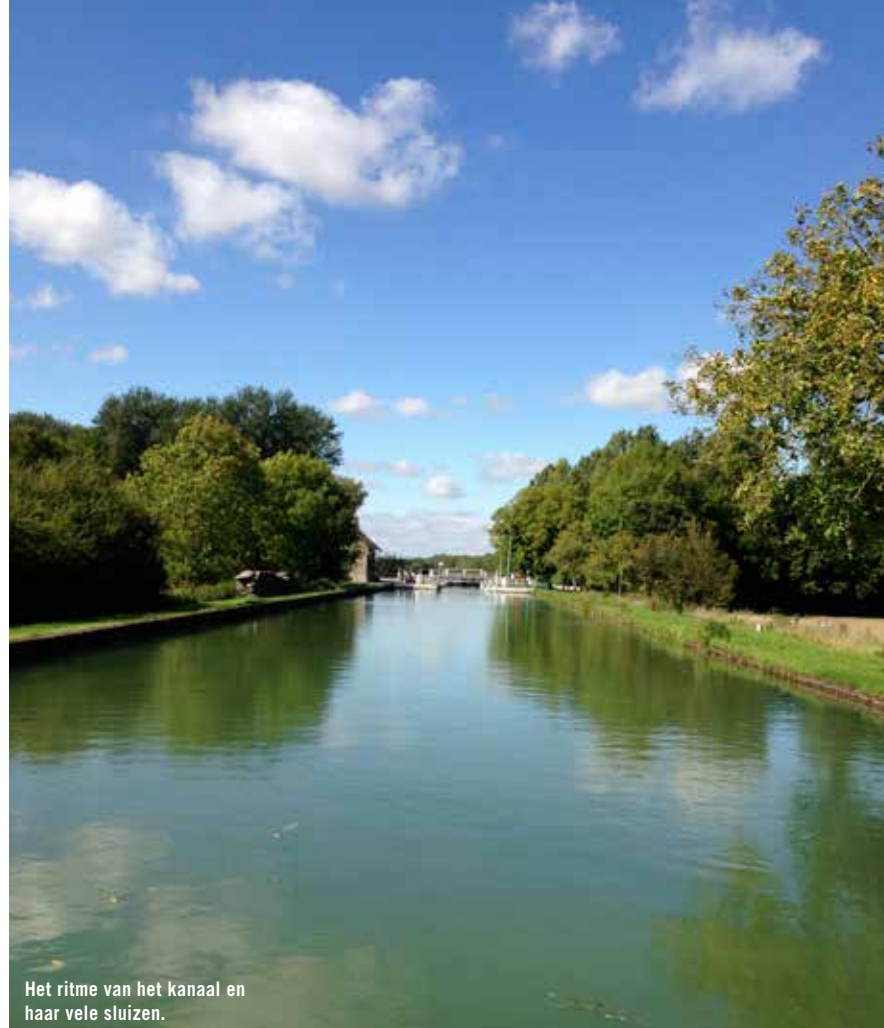
Het ritme van het kanaal en haar vele sluisen.

Elke sluis heeft een sluiswachtershuisje. Die zijn veelal bewoond, maar niet meer door sluiswachters. Op de route die wij nemen zijn eigenlijk geen echte sluiswachters meer. Dan weer krijg je een afstandsbediening om de sluisen zelf te openen, dan weer moet je aan een stang draaien die aan een kabel over het water hangt. De sluisen hebben het spitsformaat van ongeveer veertig bij vijf meter. Omdat de bolders boven op de sluismuur zitten en dit vaak te hoog is om de lijnen te gooien klimt Eef soepel de ladder op. Achter- en