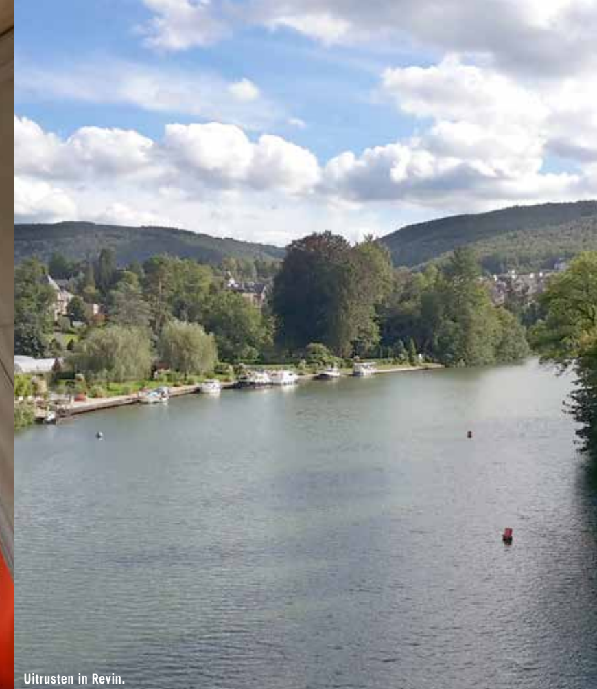
Luik varend verkennen.