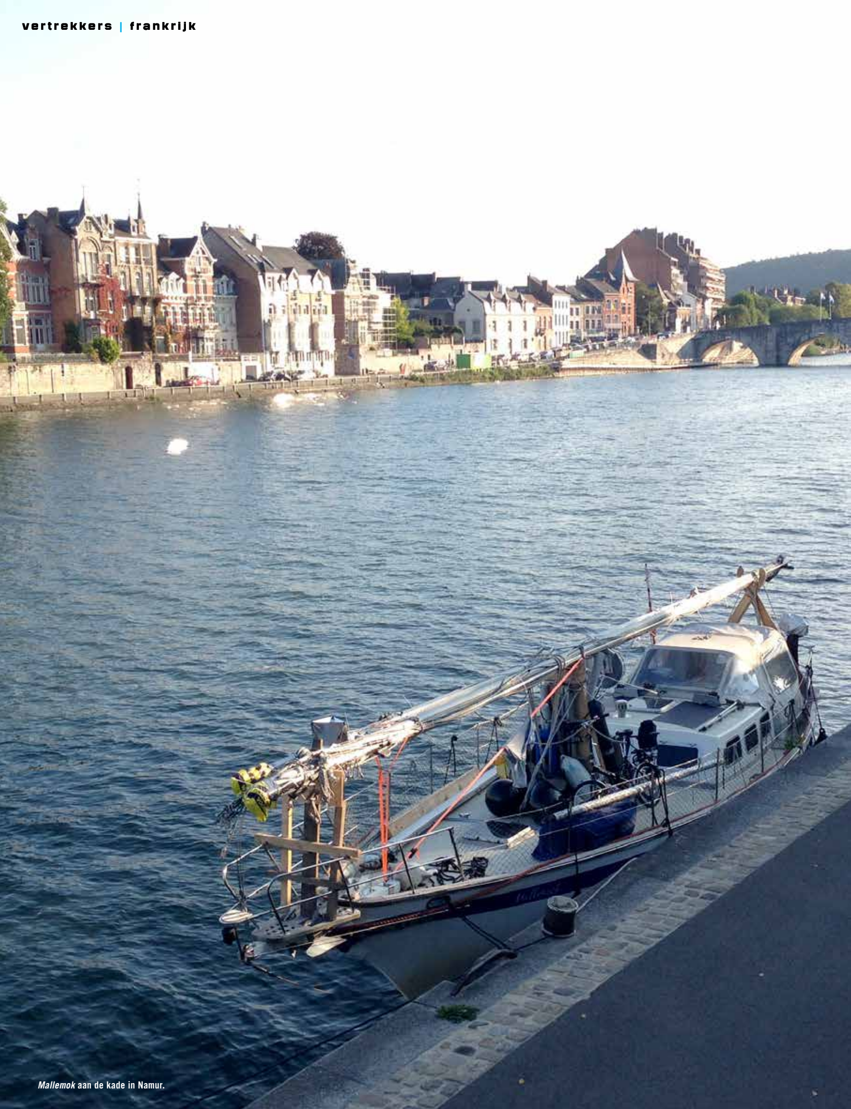
Mallemok aan de kade in Namur.