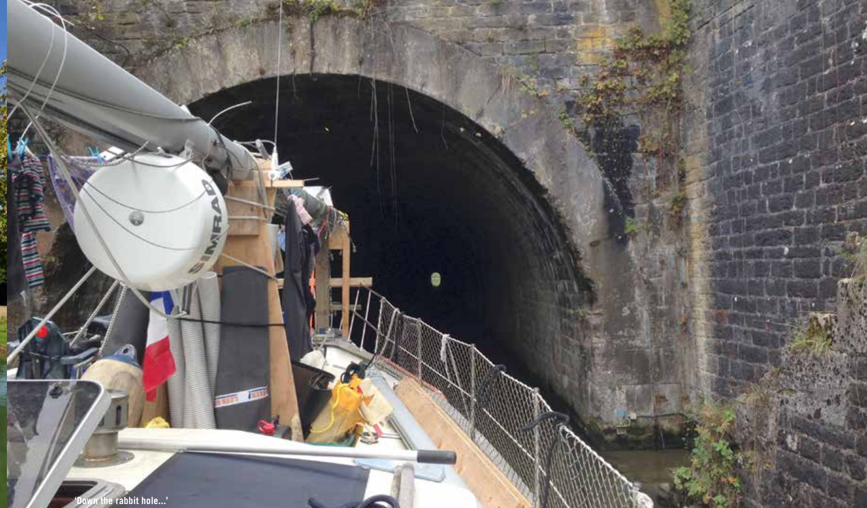
‘Down the rabbit hole...’

voorlijn eromheen en weer naar beneden. Zijn we er klaar voor, dan duwen we de blauwe stang omhoog om het schutten te starten. Vaak komt het water met enig geweld naar binnen. Er is ook een rode stang om het schutten te onderbreken, een noodrem. Verder is er een intercom om een defect door te geven. We ervaren dat elke sluispassage net weer anders is en geen sluis hetzelfde. De sluisenketen bij Le Chesne van 27 sluisen in negen kilometer is een bijzondere ervaring.