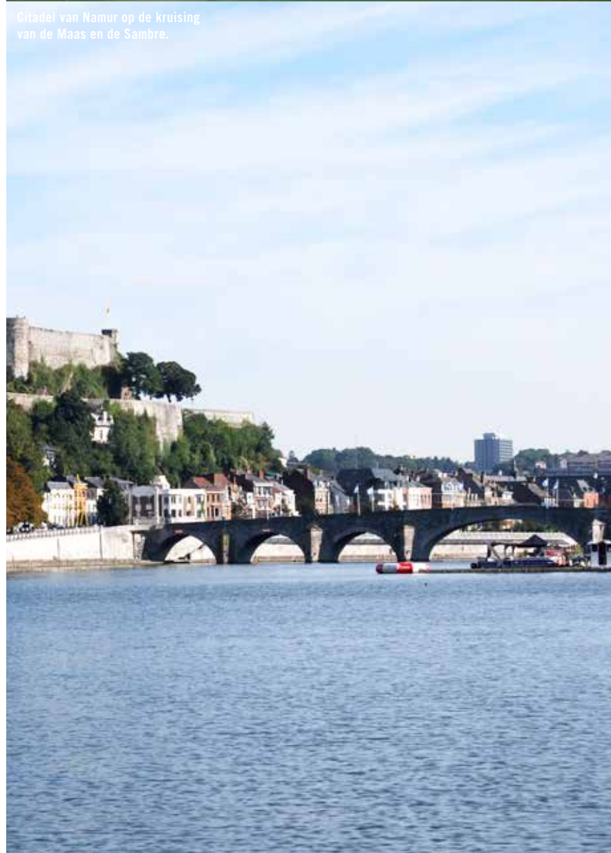
Citadel van Namur op de kruising van de Maas en de Sambre.